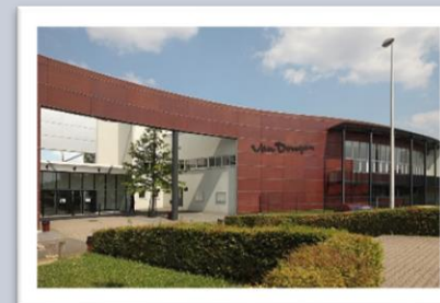
LGT Van Dongen Lagny-Sur-Marne