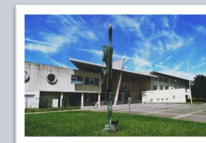
LGT Martin Luther King Bussy-Saint-Georges