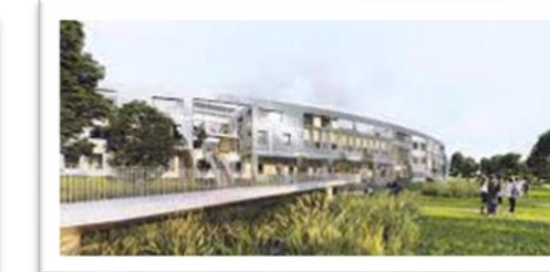
LPO Jean Moulin Torcy