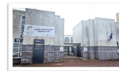
LPO Simone Veil Noisiel