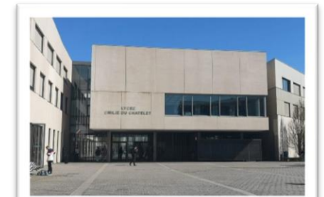
LPO Emilie du Châtelet Serris