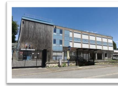
LPO Auguste Perdonnet Thorigny-Sur-Marne